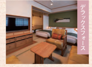
デラックスフリース