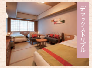
デラックストリプル