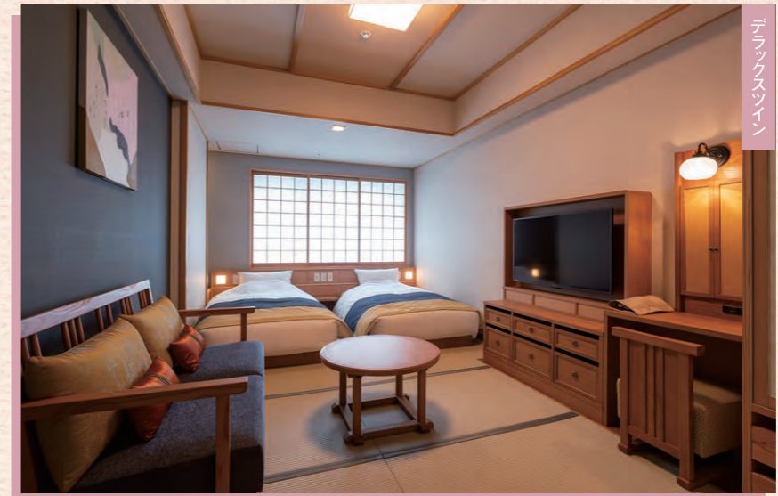
デラックススイート